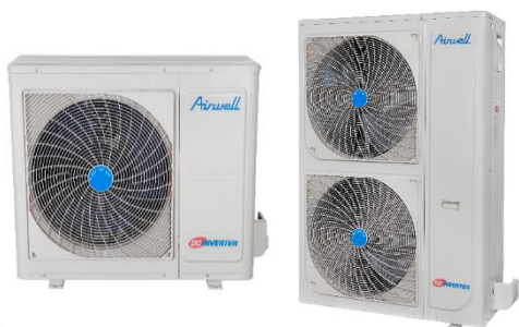
Anciennes Unités extérieures YLD