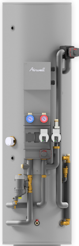
HYDRODUO TERE0 200L ou 300L ECS + 90L tampon