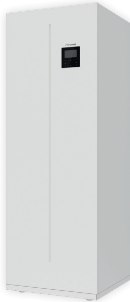
WELLEA WT ballon ECS inclus