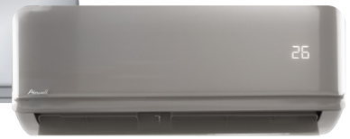
HDMB Harmonia Gris