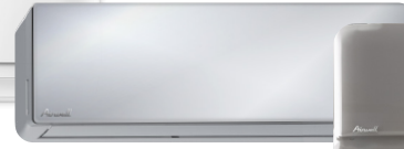
HDMB Harmonia Miroir