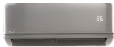
HDMB Harmonia Gris

2 SÉLECTIONNEZ ENSUITE LA RÉFÉRENCE DE LA FAÇADE COULEUR