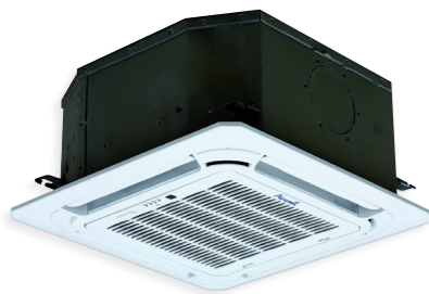
CDMX 022N-025N- 035N-050N