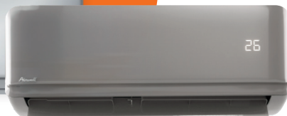
HDH Harmonia Gris

Choisissez la couleur de votre unité intérieure