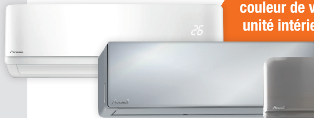
HDH Harmonia Miroir

Choisissez la couleur de votre unité intérieure