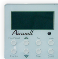
RCWE incluse avec DAF