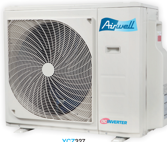
YCZ327 YCZ430 YCZ542