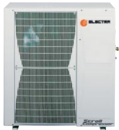
OU ECFXL 36/45 RCT

La gamme des cassettes ECFXL représente le compromis idéal pour la climatisation des espaces tertiaires :