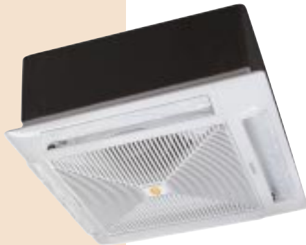
ECF 9/11/15/18 RC