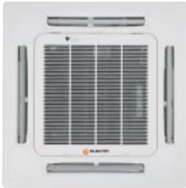
ECFXL 24/30/36/45 RC