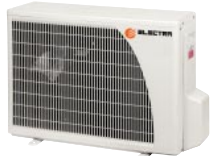
GCNG 9/12/14 RC

La structure en matériau polyester thermostable permet la réduction des niveaux sonores, du poids et allongement de la durée de vie. Le traitement anticorrosion avec revêtement peinture poudre High density assure une haute résistance quelles que soient les conditions de fonctionnement.