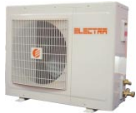
GCN 18/24 RC

Le traitement anticorrosion avec revêtement peinture poudre High density assure une haute résistance quelles que soient les conditions de fonctionnement.