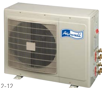
DUO 9-9 / 9-12 / 12-12

Equipés de compresseurs rotatifs garantissant faible consommation d'énergie et discrétion sonore, les groupes de condensation extérieurs Multisplits DUO sont traités avec le revêtement peinture poudre "High Density" qui leur assure une forte résistance quelles que soient les conditions de fonctionnement.