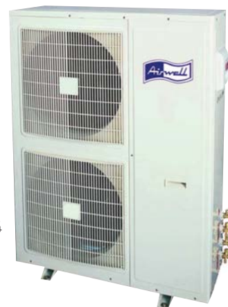
DUO 18-18 / 24-24