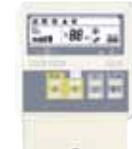
RCW5 pour FAF060 (option)