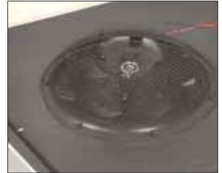
Turbine à faible niveau sonore.