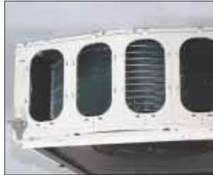
Orifices de soufflage sur 2 côtés opposés.