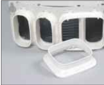
Adaptateurs pour gaines souples. 6 adaptateurs pour gaines cylindriques (8 à 12") compris dans la fourniture.