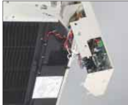
Coffret électrique coulissant. Accès direct à tous les raccordements électriques.