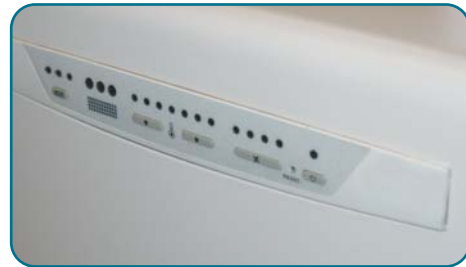
Platine de commande