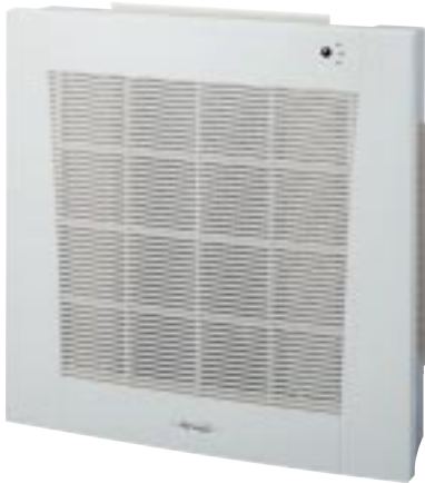
XLS 7/9/12 RC