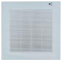
Couleur Façade : Grey (Pantone 427)

En fonction du type de décoration intérieure, il est possible de personnaliser le Louisiana XLS avec des façades de couleur disponibles en accessoire.