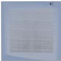
Couleur Façade : Blue (Pantone 535)