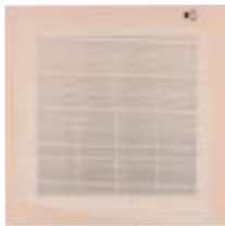
Couleur Façade : Champagne (Pantone 475)