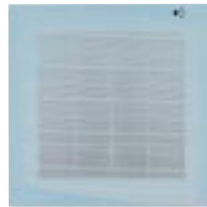
Couleur Façade : Light Blue (Pantone 552)