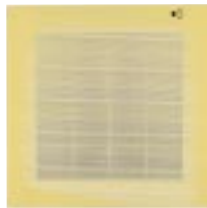
Couleur Façade : Yellow (Pantone 120)