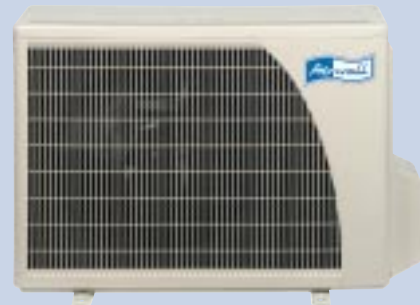
GCNG 9/12 RC

La structure en matériau polyester thermostable permet la réduction des niveaux sonores, du poids et allongement de la durée de vie. Le traitement anticorrosion avec revêtement peinture poudre High density assure une haute résistance quelles que soient les conditions de fonctionnement.