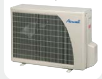
GCNG 9/12 RC

La structure en matériau polyester thermostable permet la réduction des niveaux sonores, du poids et allongement de la durée de vie. Le traitement anticorrosion avec revêtement peinture poudre High density assure une haute résistance quelles que soient les conditions de fonctionnement.