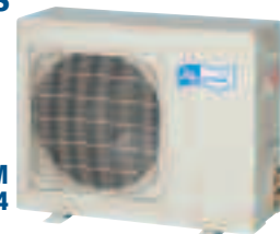
GC SIM 18/24