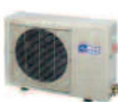
GC SIM 9/12