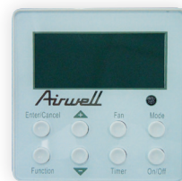
RCWE incluse avec DAF