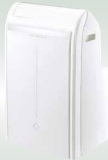
AELIA N 009/012